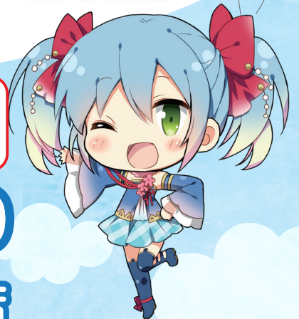
小樽アニメパーティー オフィシャルキャラクター かなる