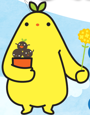
Na-No なの花 なの花薬局キャラクター