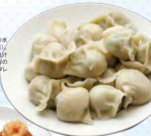
横浜中華街「山東」の水餃子(10個入735円)。皮はもちもち、中は肉汁が絶品!コナッツ入りの秘伝の自家製ピリ辛ダレをつけていただきます。 ・横浜市中区山下町150

新山下にある「TYCOON(タイクーン)」は、アジア各国の料理人が手掛ける本場エスニック料理が味わえるレストラン。埠頭の倉庫を改装した大型店で、ドラマなどのロケ地としても有名です。店内は南国のリゾート地に迷い込んだかのような。夜景が望める海側の席でエキゾチックな味を満喫! 景色も料理も最高の横浜の魅力です。