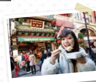
大注目の点心「王府井(ワンフーチン)」の焼き小籠包(6個入720円)。香ばしくてもちもち、溢れ出す肉汁!!