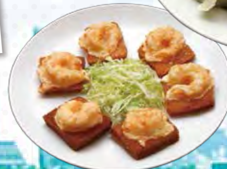
カリッと香ばしい、車海老入りのパンはさみ揚げ(1,575円)