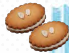
「横浜山手えの木てい」チェリーサンド(1個210円) 外国人居留地だった横浜山手地区。純英国式洋館を使った洋菓子店&ティールームがある同店のロングセラ―菓子。