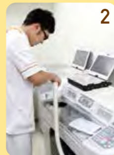
②異物混入防止のため、作業前に清掃をします。