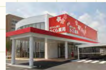
さくら薬局 九州労災病院前店

九州北部を中心に「さくら薬局」の名称で35店舗を展開する調剤薬局事業と、「さくら本舗」のブランドで健康食品事業を展開する株式会社トータル・メディカルサービスが、2013年11月、なの花薬局グループの九州・中国エリアの運営会社として仲間入り。福岡、佐賀、長崎、そして山口エリアへと広がり、今後もますます身近で頼れる「地域薬局」として、全国の皆様のお近くで一人ひとりの健康と地域医療に貢献してまいります。