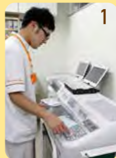
①専用の機械に、包装する数を入力します。

一包化とは医師の指示のもと、数種類のお薬を1回分毎にまとめる作業です。朝・昼・夕食後それぞれ飲むお薬の種類や量が違うなど、お薬の種類が多くて飲み間違いがあったり、お薬の管理が大変な方にメリットがあります。