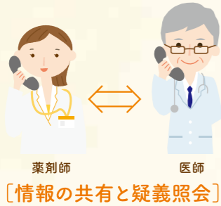
薬剤師 医師 [情報の共有と疑義照会]

処方せんに間違いがないか、重複しているお薬はないか、また相互作用に問題はないかなどを確認。内容によっては医師に問い合わせ、問題があれば処方内容を検討してもらうこともあります。