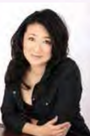
北海道札幌市生まれ。北海道大学農学部で、応用動物学を専攻する。1990年にノンフィクション『結婚しないかもしれない症候群』がベストセラーとなる。2003年長編小説『海猫』(新潮社)が、第十回島清恋愛文学賞を受賞。他に、女性の医師を主人公にした『余命』、新刊として『尋ね人』(共に新潮社)、『空しか、見えない』(スターツ出版)がある。