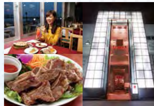
「TYCOON」はまるで南国のリゾート地!カクテル、タイクーン・スペシャル(950円)で乾杯。(左)肉食の私のおすすめヌアヤーン(1,200円)は、骨付き牛肉のタイ風炭火焼。 ・横浜市中区新山下町3-4-17