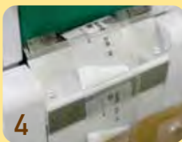
④完成。一袋ずつお名前と飲むタイミングなどを印刷しています。