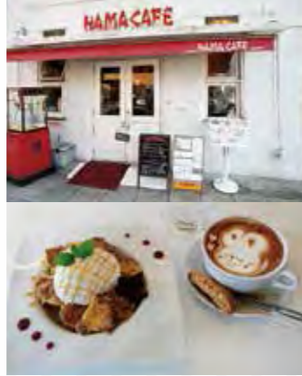
HAMA CAFE ・横浜市中区海岸通1-1