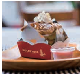
北海道産小麦100%の生地に道産りんごを重ねた『さっぽろりんごミルクフィーユ 〜ソースを添えて〜』は、“さっぽろスイーツ2017コンペティション”グランプリ受賞ケーキ