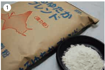
①パン用の強力粉「はるゆたかブレンド」。1990年には「北海道産小麦100%シリーズ」が実現した

「その中に、国産小麦で作ったパンミックスが欲しいというご要望がありました。家庭で手作りするのなら、安全・安心な材料で作りたい」と。家族を想う主婦の切なる願いでした。