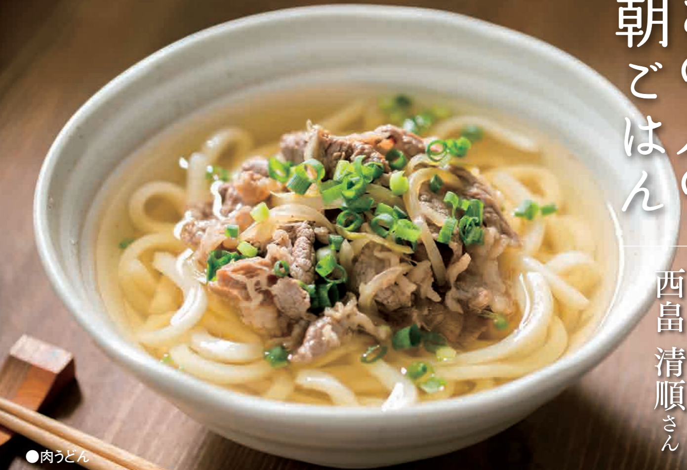
●肉うどん (体調に合わせて梅干しを入れる)