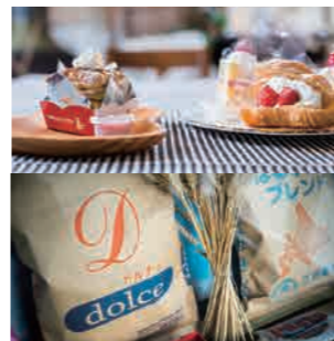
江別製粉が菓子用に開発した中薄力粉の『ドルチェ』(品種きたほなみ)を主に使用。しっとりとした食感と、ほのかな甘みが特長です